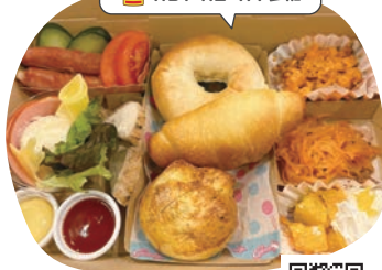
シェ・サン マカン☆マカン

自家農園野菜を使ったサラダと手作りパン。そのまま食べても、お好みでサラダやチキンを挟んでも、フルーツサンドにしても絶品です! 幸せが詰まったBOXです。