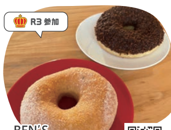
BEN'S MORNING CAFE ふわもちドーナツ