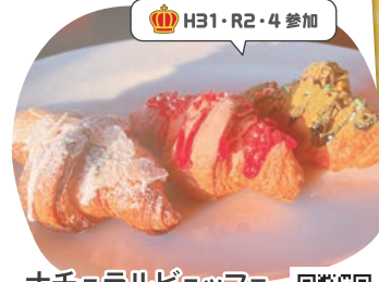
ナチュラルピュッフェ ユコーネ 映えチョコワッサン

ユコーネ人気のクロワッサンを抹茶、ホワイトチョコ、ストロベリーチョコの3つの味で楽しめます。