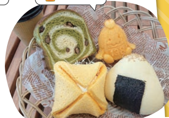
JA愛知西産直広場南小淵店パン工房 おこめのパン屋さん 一宮おこめモーニング

地元のお米と卵を使ったJAならではの地産地消メニューです。つきたてのお米で作った米粉おにぎりパンや米粉スイーツは、まさに絶品!