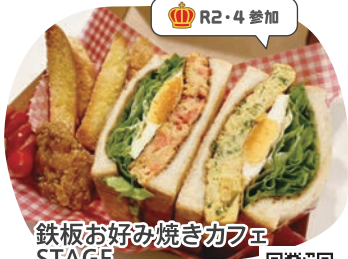
鉄板お好み焼きカフェ STAGE お好み焼きサンド (スキサン)セット

パンにお好み焼きをサンドするのが当店の鉄板メニューです。カフェならではのSDGs食材を多用し、コストダウンとボリュームアップをしました。お好み焼きサンドは是非「スキサン」と呼んで下さい。