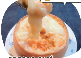
COCORO CAFE パンの器の クリームドリア

パンの器に入ったオニオンバターライスに、クリームシチューとモッツアレラチーズをのせて販売します。温めて(焼いて)お召し上がりください。