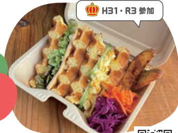
cafe merneige ワッフルサンドBOX

ワッフルで卵サラダ、ハムチーズを挟んだおかず系サンドイッチです。甘じょっぱいワッフルとの相性は抜群! ポテトフライ、キャベツマリネ、人參ラベで彩りも華やかです。